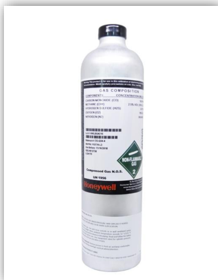
Exemplo de cilindro de para testes de detectores de gás