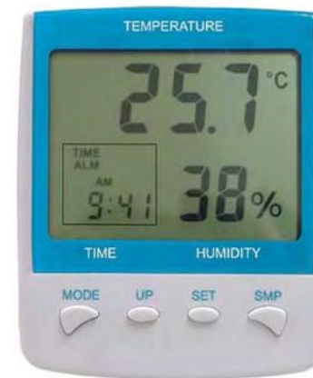
Figura 5 – Termo-higrômetro digital, com indicação de temperatura (resolução de 0,1 °C) e umidade relativa (resolução 1%)

Em instrumentos com mostradores digitais, a resolução corresponde ao incremento digital. Vamos analisar um exemplo de um termo-higrômetro digital.