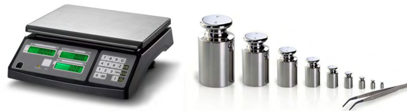
Figura 2 – Balança eletrônica (instrumento de medição indicador para medição de massa) e pesos-padrão (medidas

Alguns exemplos típicos de medidas materializadas são: peso-padrão, medida de capacidade (que fornece um ou mais valores, com ou sem escala de valores), resistor-padrão, escala graduada, bloco-padrão, gerador-padrão de sinais, material de referência certificado.