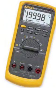
Figura 4 – Leitura de uma grandeza em um instrumento de medição digital

Um instrumento de medição indicador com mostrador digital mostra diretamente o valor da grandeza a medir através de algarismos ou dígitos em um visor.