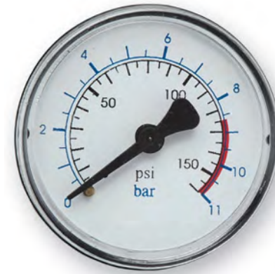
Figura 6 – Manômetro analógico (resolução de 0,25 bar e 2,5 psi)

Na figura seguinte, representamos um manômetro. O valor de cada divisão da escala com unidades em bar é de 0,5 bar e o operador pode perceber uma variação da pressão de 0,25 bar. Na escala em psi, o valor de cada divisão é de 5,0 psi e o operador pode perceber uma variação da pressão de 2,5 psi.