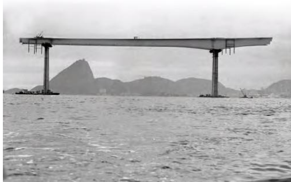
Imagem 1: Construção da Ponte Rio-Niterói. Ao fundo, o Pão de Açúcar. As peças enormes, pré-fabricadas, se encaixam umas nas outras com exatidão milimétrica.