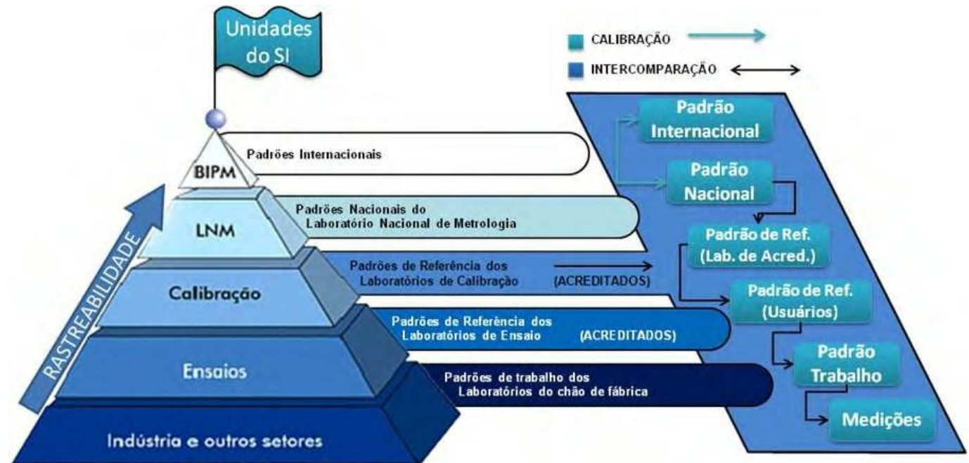
Imagem 5: Esquema que garante medições.

A figura a seguir mostra um esquema do sistema geral que garante as medições que efetuamos.