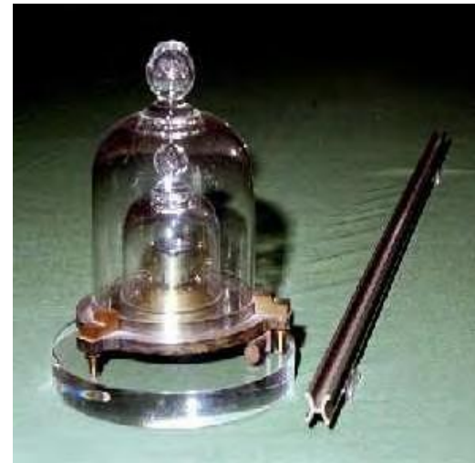
Imagem 3: Padrões de massa e de comprimento.

O quilograma, unidade básica de medida de massa, foi definido como a massa de um litro de água. O litro foi definido como o volume de um decímetro cúbico. Em 1799 foram criados os padrões materializados de comprimento e massa, sendo o primeiro uma barra de uma liga metálica de platina e irídio e o segundo um cilindro com massa correspondente à massa de um litro de água e também feito de uma liga de platina e irídio.