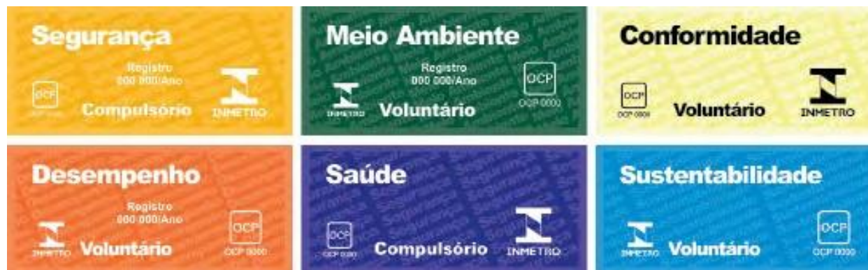
Figura 3: Selos de identificação da conformidade

Veja, a seguir, alguns dos selos de identificação da conformidade, criados para identificar cada um dos mecanismos de avaliação da conformidade existentes e praticados nacional e internacionalmente.