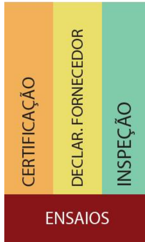
Figura 1: Mecanismos de avaliação da conformidade.