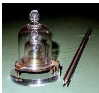
Imagem 3: Padrões de massa e de comprimento.

Em 1799 foram criados os padrões materializados de comprimento e massa , sendo o primeiro uma barra de uma liga metálica de platina e irídio e o segundo um cilindro com massa correspondente à massa de um litro de água e também feito de uma liga de platina e irídio.