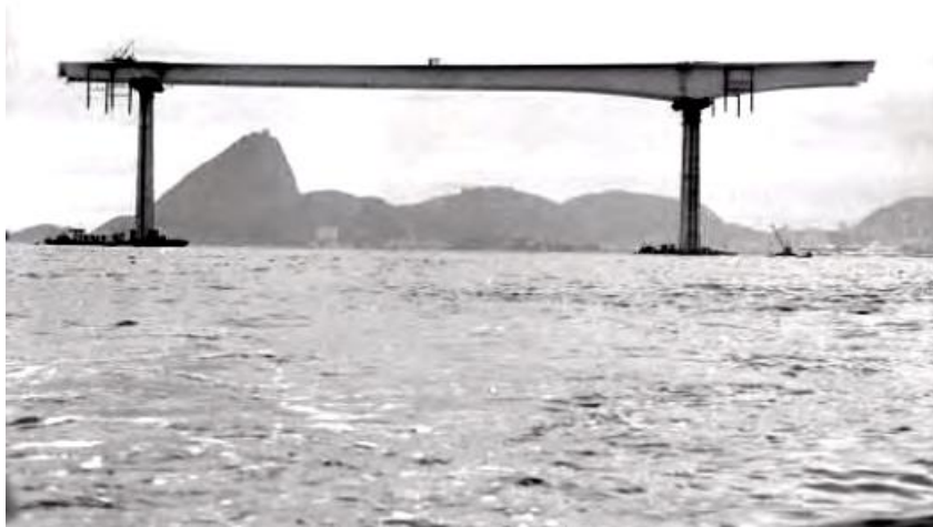
Imagem 1: Construção da Ponte Rio-Niterói. Ao fundo, o Pão de Açúcar. As peças enormes, pré-fabricadas, se encaixam umas nas outras, com exatidão milimétrica.

Agora imagine uma obra gigantesca, como a Ponte Rio-Niterói. É uma das maiores obras de engenharia do planeta e está entre as maiores pontes do mundo. Sua construção também se deu utilizando blocos. Porém, neste caso, eles são enormes, da ordem de dezenas ou centenas de metros. E nesse caso, também, se exige um encaixe perfeito.