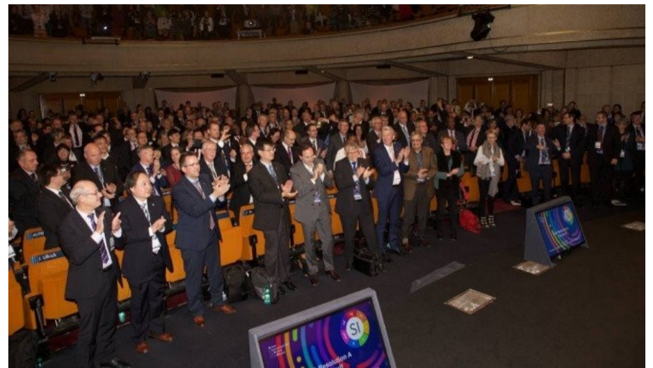
16.11.2018. Participantes da 26ª CGPM aplaudem a decisão unânime que mudou as definições dos padrões de medidas fundamentais.

2019 é um ano especial. Neste ano, no dia 20 de maio, será oficializada a adoção do novo Sistema Internacional de Unidades – SI. Uma mudança que vem sendo trabalhada há muitos anos e que pode ter impacto importante no ensino de Física. Você conhece o novo SI?