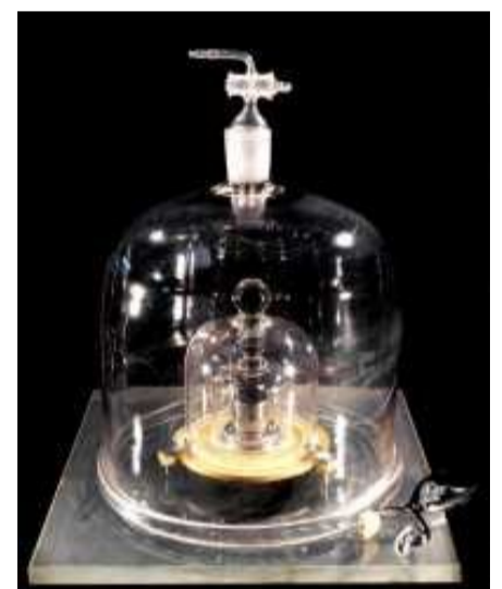
O IPK (1889) deixa de ser o padrão de massa a partir de 20 de maio de 2019.

A Sociedade Brasileira de Metrologia, sociedade científica que tem como um de seus objetivos a disseminação da cultura metrológica, convida-a(o) a responder a um questionário sobre noções básicas dessa ciência. Nosso propósito é conhecer melhor o seu domínio em relação a esses conceitos.