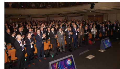
16.11.2018. Participantes da 26a CGPM aplaudem a decisão unânime que mudou as definições dos padrões de medidas fundamentais.