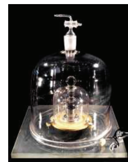
O IPK (1889) deixa de ser o padrão de massa a partir de 20 de maio de 2019.

Nosso propósito é conhecer melhor o seu domínio em relação a esses conceitos.