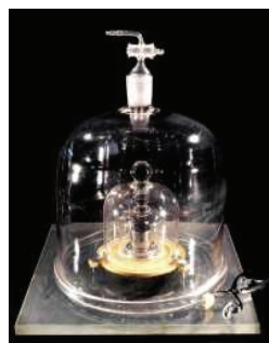
O IPK (1889) deixa de ser o padrão de massa a partir de 20 de maio de 2019.

Nosso propósito é conhecer melhor o seu domínio em relação a esses conceitos.