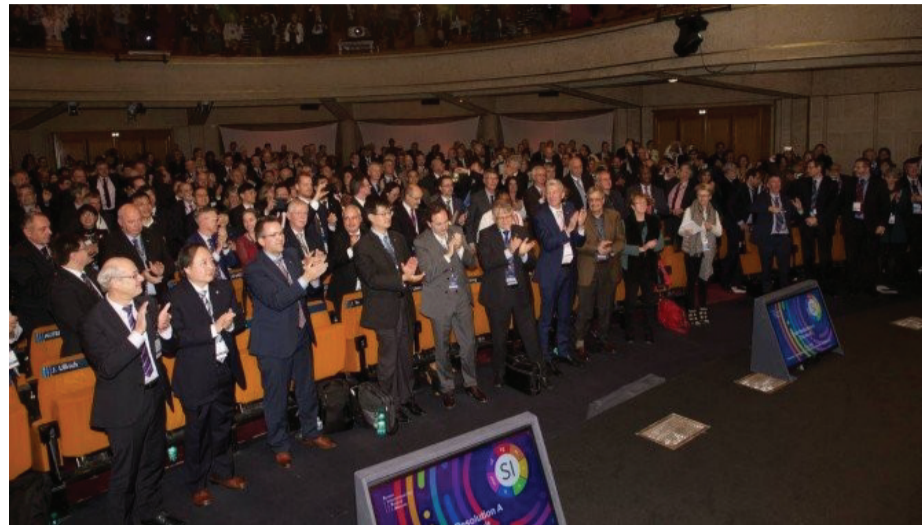
16.11.2018. Participantes da 26a CGPM aplaudem a decisão unânime que mudou as definições dos padrões de medidas fundamentais.