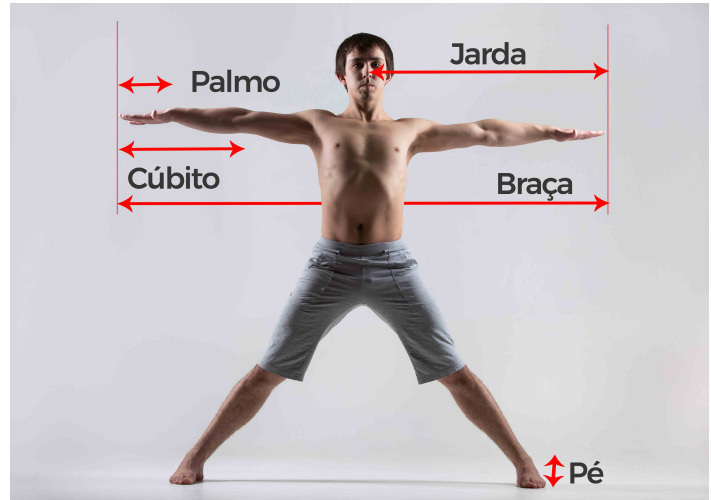
Figura 1.: Medidas primitivas com base no corpo humano.

O sistema métrico decimal foi criado após a revolução francesa. A Convenção do Metro foi assinada por representantes de dezessete (17) países, entre eles o Brasil, em 20 de maio de 1875, em Paris. Com ela, a criação do Sistema Métrico Decimal foi o passo inicial que para a criação do Sistema Internacional de Unidades (SI), na 11ª Conferência Geral de Pesos e Medidas (CGPM), realizada em 1960.