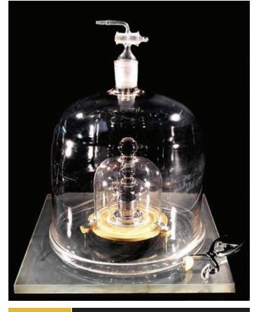
Protótipo internacional do quilograma conservado no BIPM.

Essa definição do quilograma, que ainda é a original da 1ª Conferência Geral de Pesos e Medidas (CGPM), de 1899, é problemática por duas razões. Primeiro, pelo fato de ser baseada em um protótipo único, sem condições de ser realizada novamente. Segundo, por haver indiscutíveis evidências de que sua massa varia com o tempo de forma imprevisível.