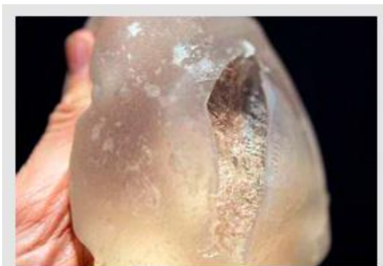
Próteses mamárias "não conformes" podem se romper e colocar em risco à saúde do paciente.

Os ensaios devem ser realizados em laboratórios acreditados pela Cgcre no escopo dos ensaios especificados acima!