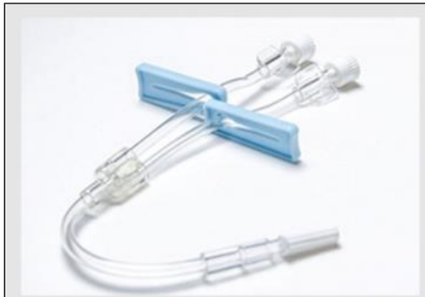
Conector multivias: dispositivo para administração simultânea de medicamentos