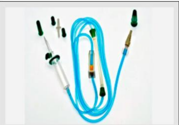
Equipo para bomba de infusão

Qual mecanismo de Avaliação da Conformidade é usado?