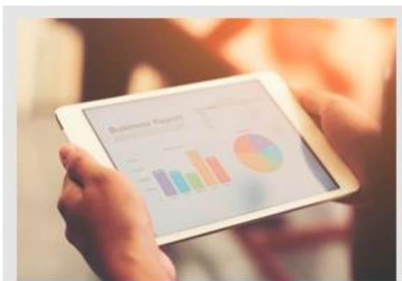
Análise Crítica x Oportunidade de melhoria

Registros dos resultados das análises devem ser mantidos (ver 4.2.5).