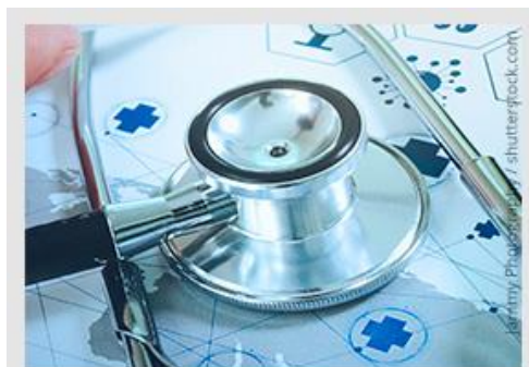
ABNT NBR ISO 9000:2015 referência indispensável para ABNT ISO NBR 13485:2016.

A ABNT NBR ISO 13485:2016 relaciona a norma ABNT NBR ISO 9000:2015, Sistemas de gestão da qualidade – Fundamentos e vocabulário , como referência indispensável para sua aplicação, uma vez que esse documento (a norma) descreve os conceitos fundamentais e princípios da gestão da qualidade.